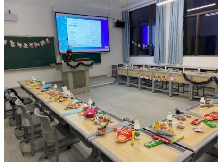
*CFA&FRM 周末班课余活动及学员服务