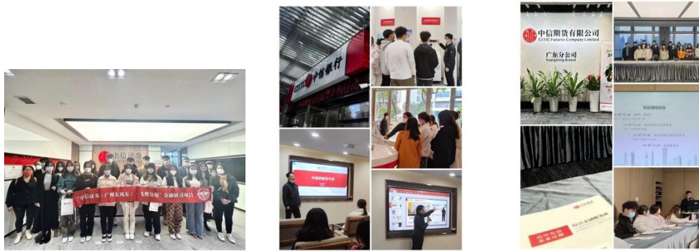
*22级学员大一寒假实地参访中信证券、中信银行、中信期货